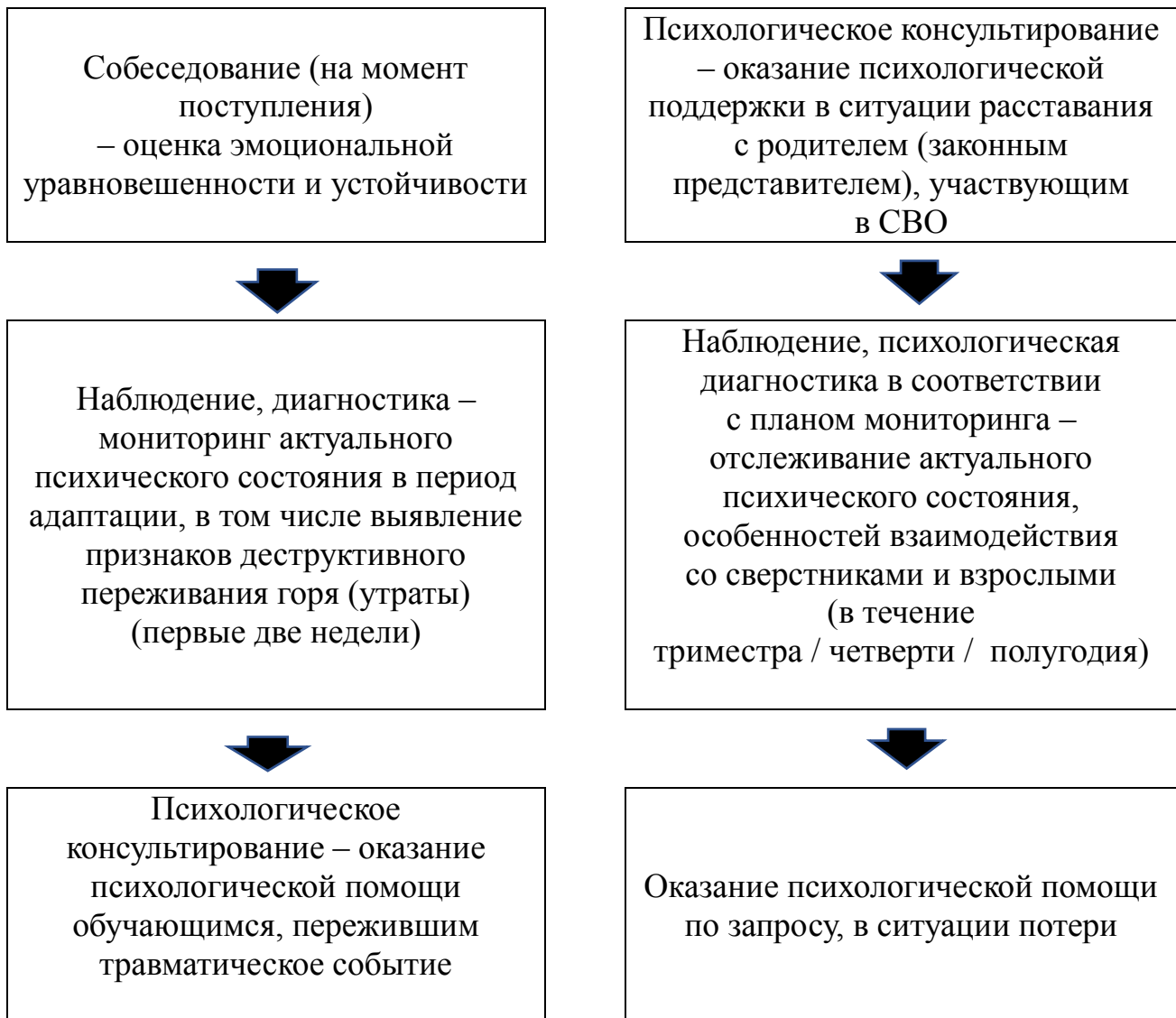
Схема выстраивания работы педагогов-психологов / психологов по психологическому сопровождению детей ветеранов (участников) СВО в зависимости от статуса пребывания обучающегося в образовательной организации

Каждое направление деятельности педагога-психолога / психолога включается в единый процесс сопровождения, обретая свою специфику, конкретное содержательное наполнение в форме программ адресной помощи (далее – психолого-педагогические программы) с учетом выявленных психолого-педагогических проблем, рисков и трудностей обучающихся целевой группы.